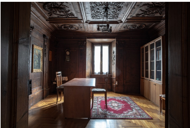
La Stua della Canonica di Vione

La scritta "Stua" da un antico atto notarile